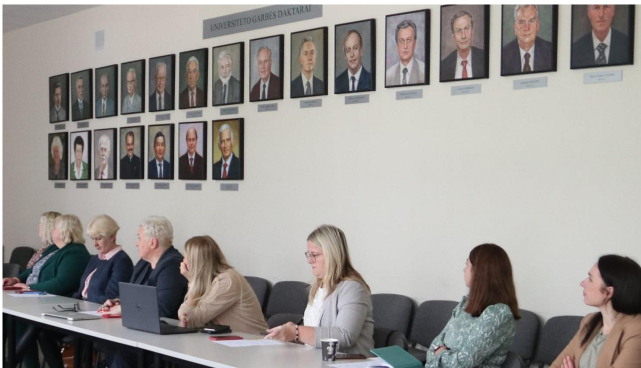
3 pav. Diskusijos darbinio seminaro metu

Antrąją konferencijos dieną projekto partnerių atstovai darbinio seminaro metu išsamiai aptarė projekto metu įgytas patirtis ir sukurtų instrumentų tolimesnio panaudojimo perspektyvas bei galimas būsimas bendradarbiavimo tęstinumo iniciatyvas.