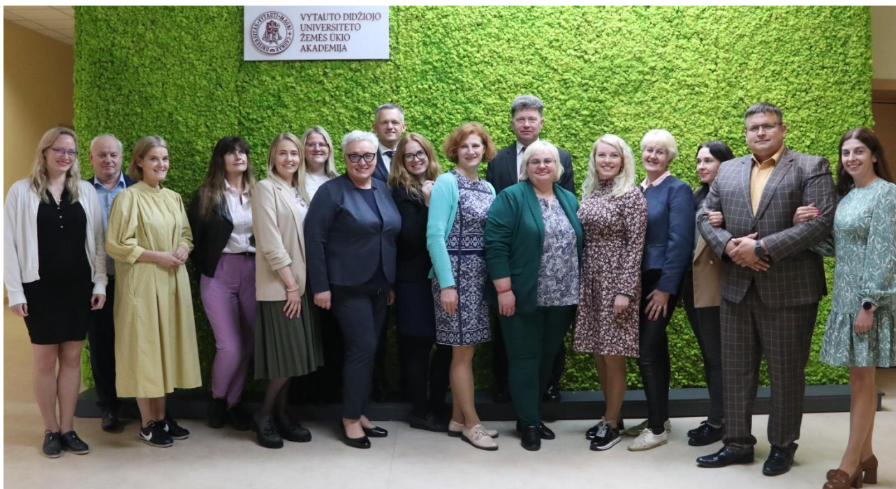
2 pav. Konferencijos pranešėjai ir diskusijų sesijos dalyviai