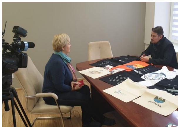
Nuotraukose iš kairės į dešinę: 1) UAB „Kibis“ įsigyta moderni įranga; 2) UAB „Kibis“ vadovas pristato įmonės veiklą ir produkciją Ignalinos televizijos žurnalistams.