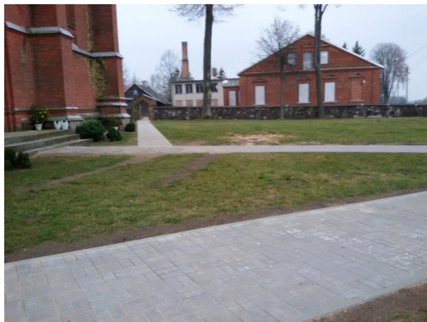
Nuotraukose naujai įrengtas pandusas prie šoninio įėjimo į bažnyčią ir takeliai.